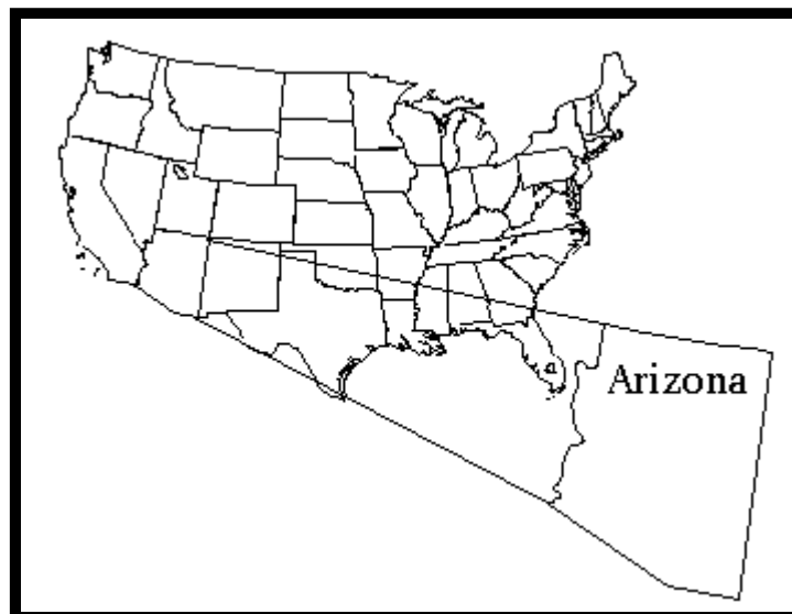
Tombstone in Arizona

Neben dem berühmtesten Bordell in der Stadt, dem "Bird Cage Theatre", gab es am Stadtrand kleinere Hütten, den sogenannten "Cribs", in denen die Prostituierten ihre Freier empfingen. Die Hauptstraßen von Tombstone wurden von Tanzhallen und Saloons beherrscht.