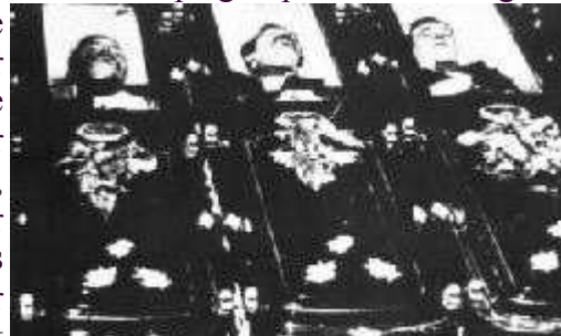
Die McLaury Brüder und Billy Clanton

steigen und sämtliche Minen unter Wasser setzte. Sämtliche Bemühungen, das Wasser wieder abzupumpen, scheiterten. In kürzester Zeit verließen mehr als ein Drittel der Bewohner die Stadt. In der Folgezeit schrumpfte